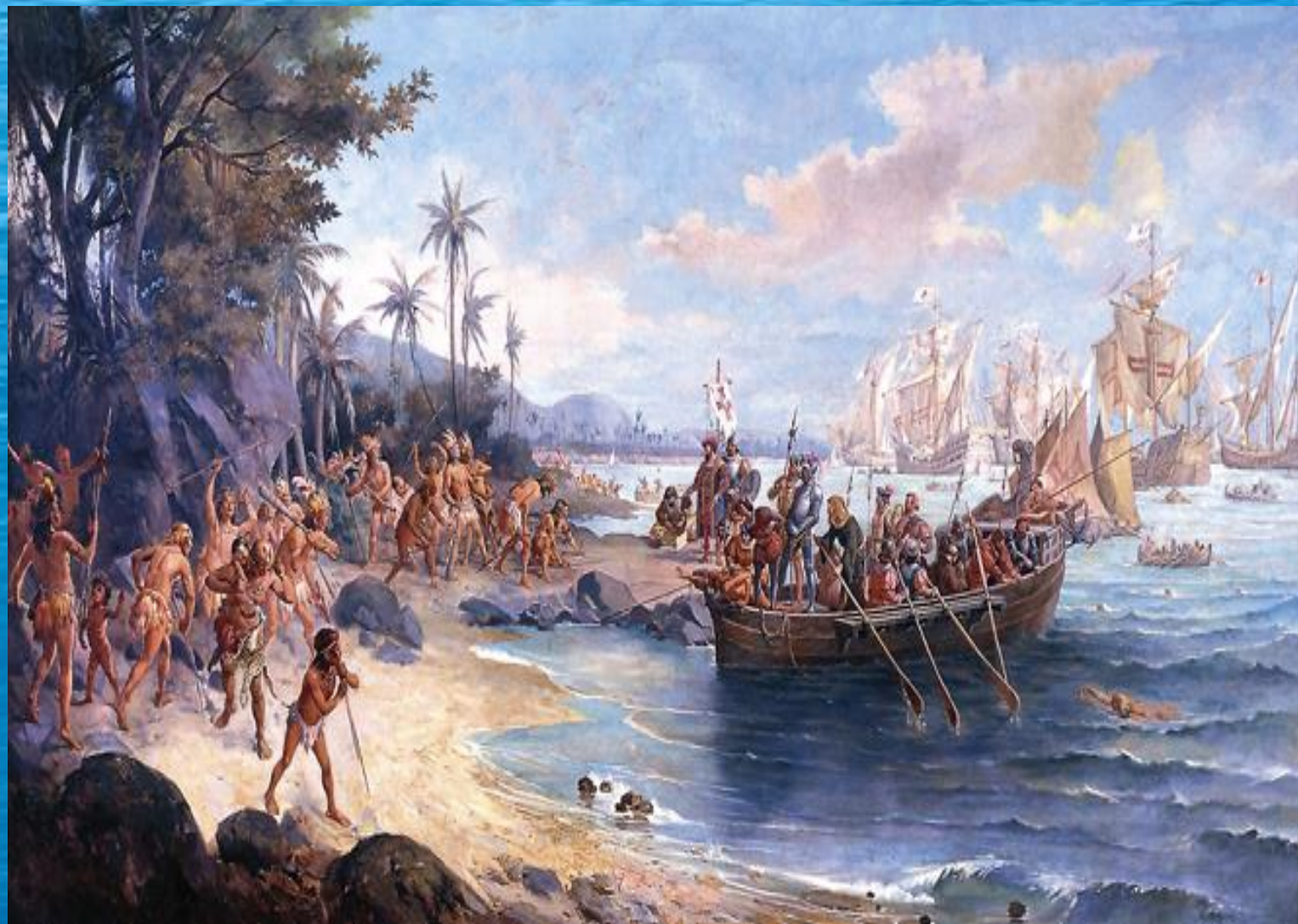
O MAR E OS DESCOBRIMENTOS PORTUGUESES