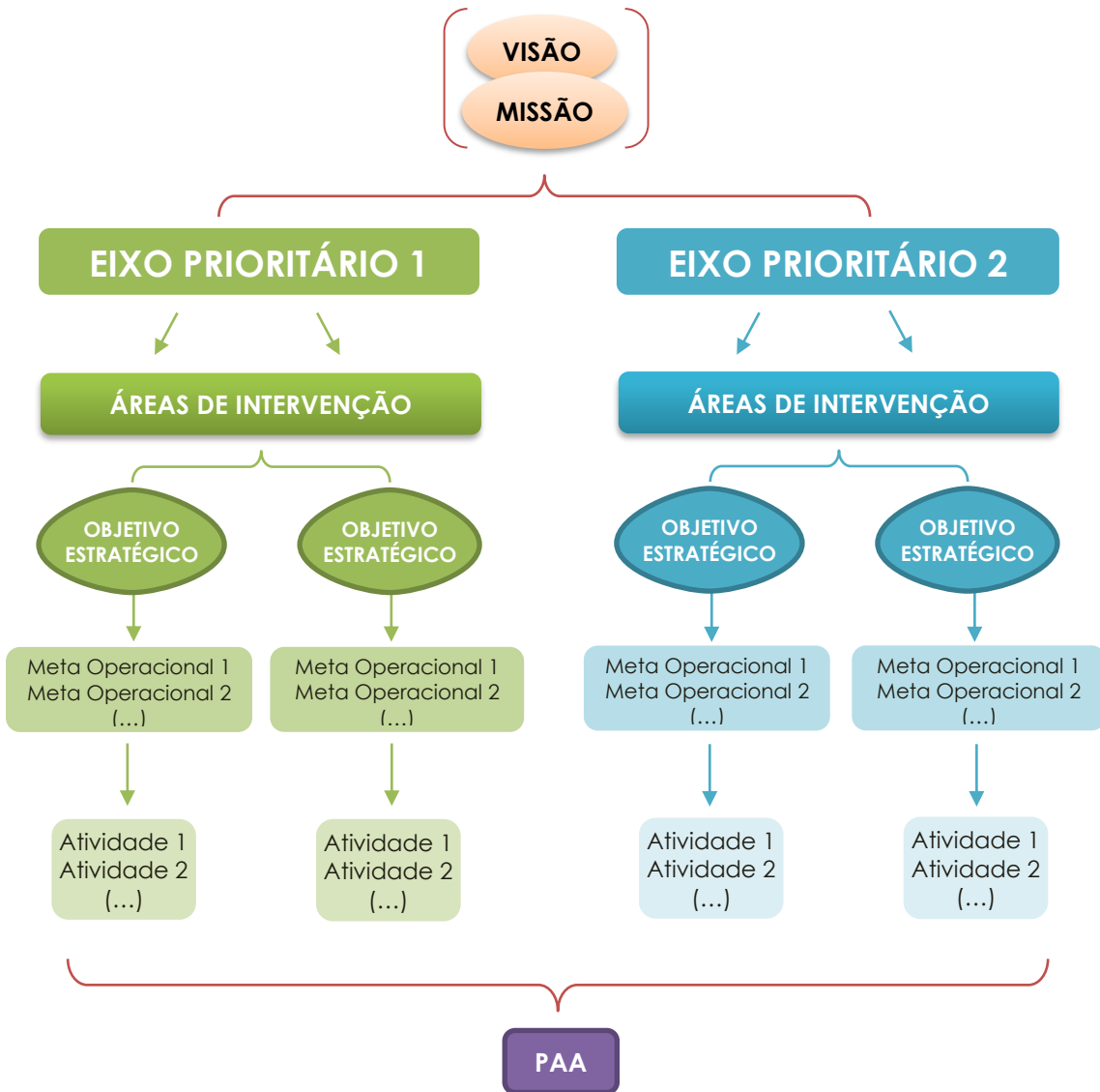
Figura 1. Matriz organizativa do Projeto Educativo da EB1/PE da Marinheira.