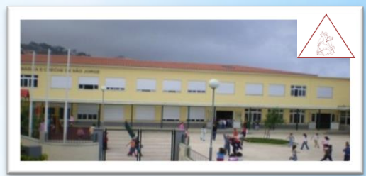
EB1/PE/C de São Jorge