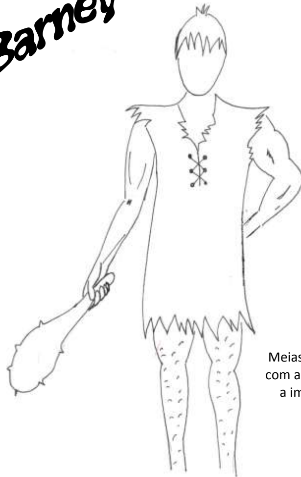
Camisola castanha com abertura no peito