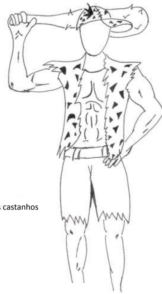
Boné revestido a imitar pele