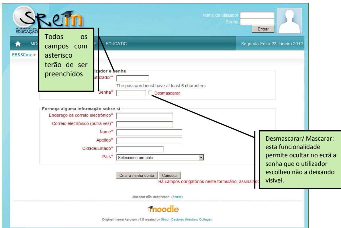
Imagem 4 - Formulário