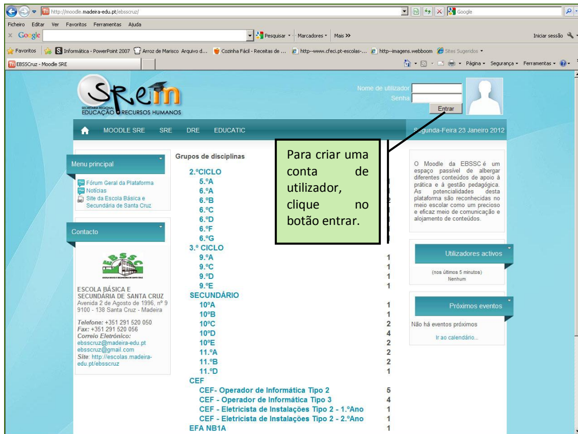
Imagem 2 - Página de entrada Moodle EBSSCruz

Como ainda não está registado, deve seleccionar “Criar uma conta de utilizador” onde lhe será apresentado um breve formulário para preenchimento com seus dados pessoais.