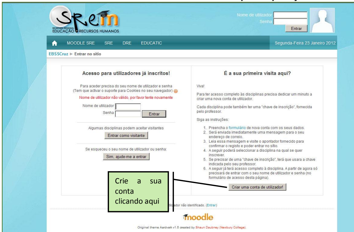
Imagem 3 -Criar uma conta de utilizador